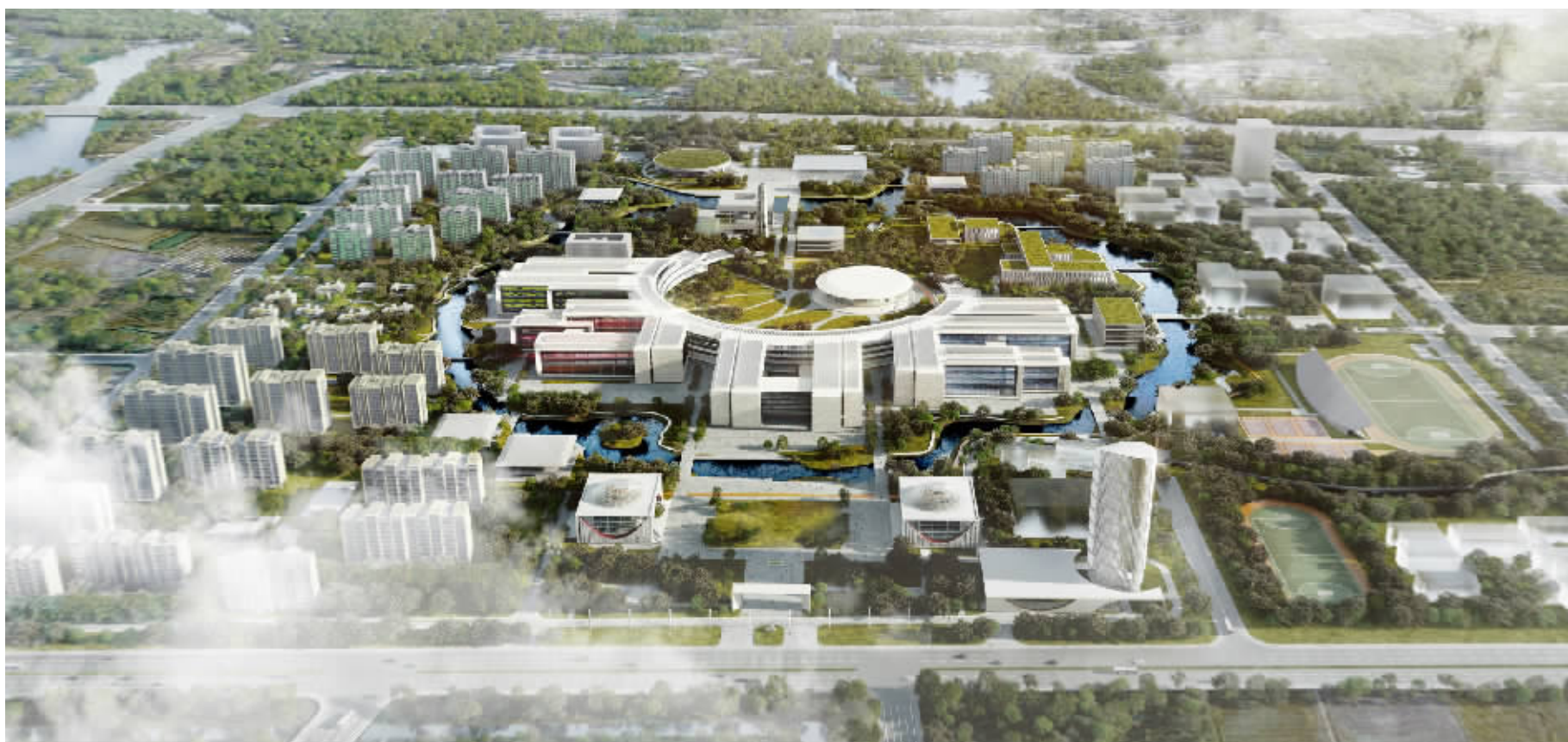
云谷校区鸟瞰效果图